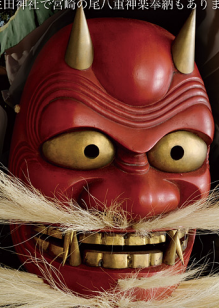
こたかぐら 巨田神楽 鬼神面 (宮崎市)