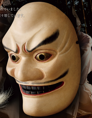
おほえかぐら たらからめん 尾八重神楽 手力面 (西都市)